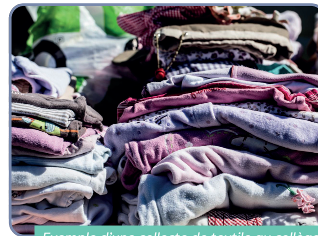
Exemple d'une collecte de textile au collège