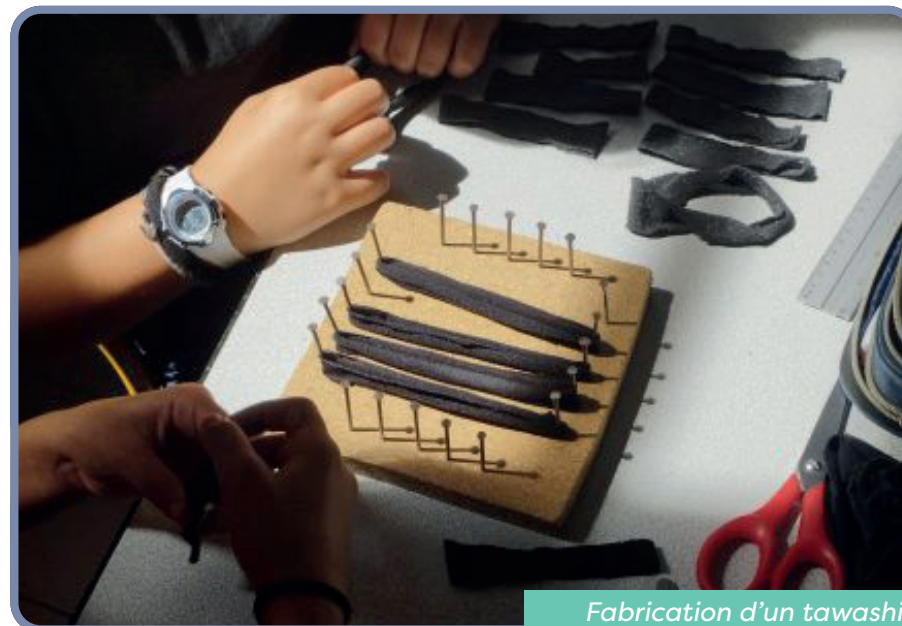
Fabrication d'un tawashi à partir de textiles réutilisés